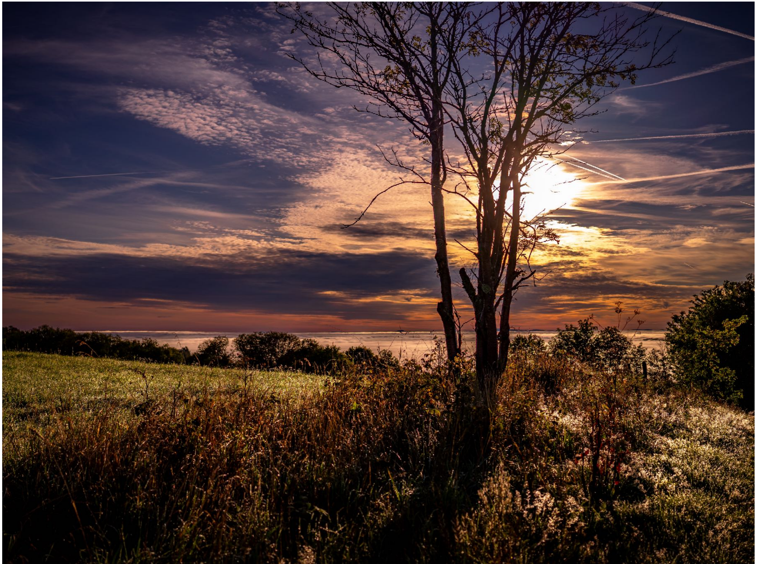
Das tiefe Morgenlicht lässt die Pflanze im Morgentau leuchten | f3,5 | 1/4000 | -1,7 | ISO 100 |