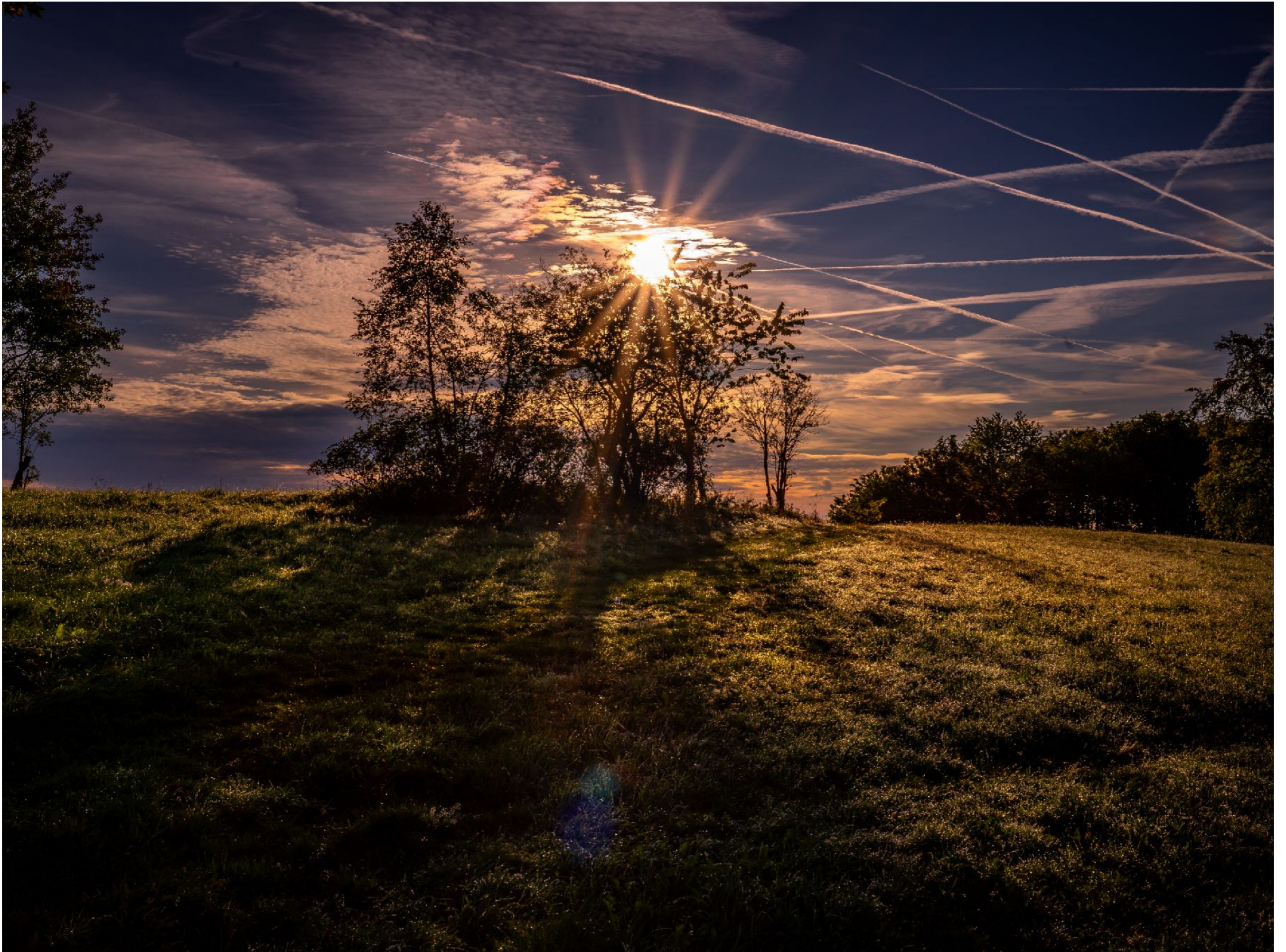
Im Vordergrund eine leichte Lichtreflexion durch das Objektiv | f20,0 | 1/500 | -2,7 | ISO 100 |