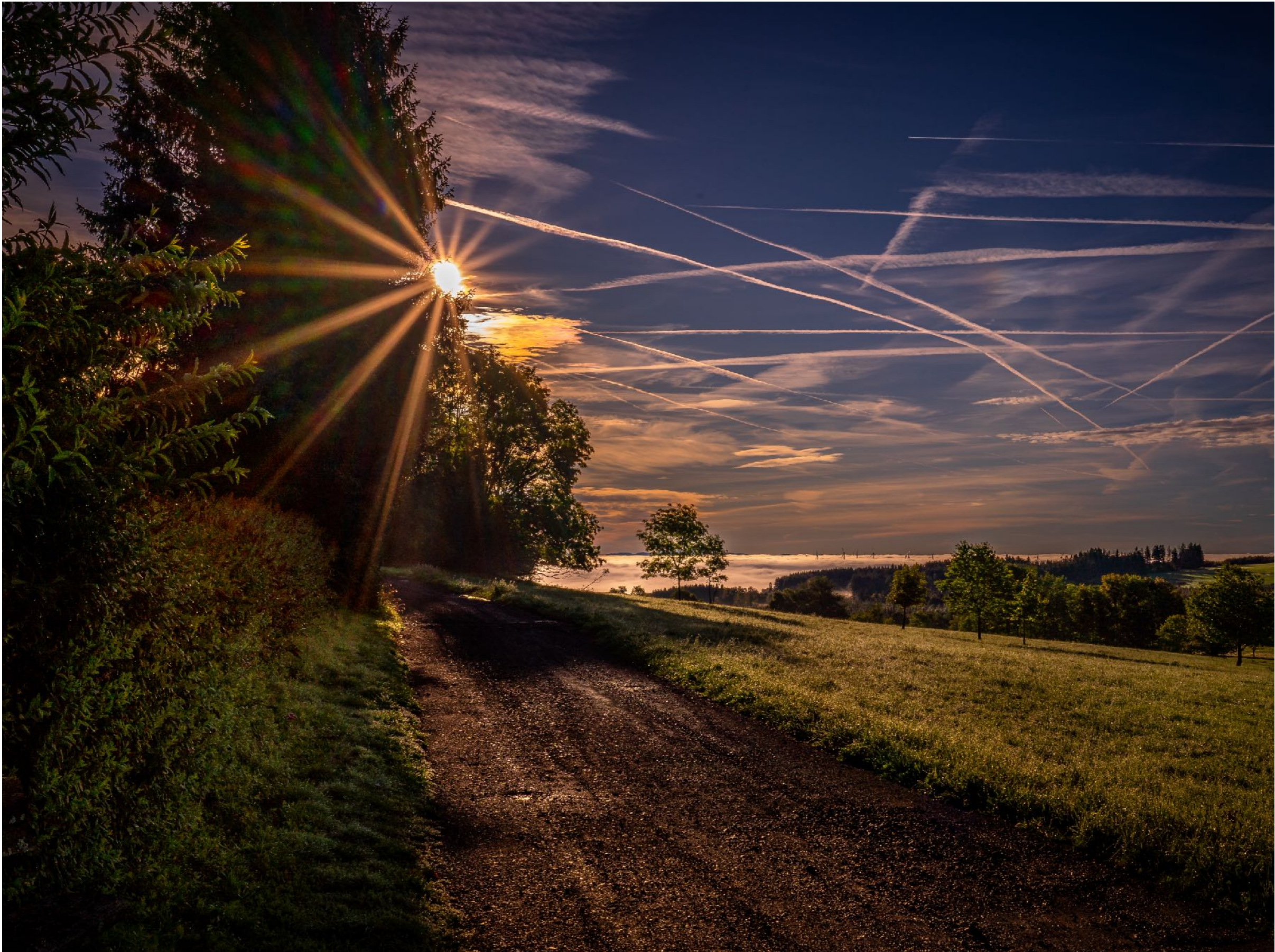
Wunderschöner Sonnenstern und Reflexionen | f20,0 | 1/640 | -2,7 | ISO 100 |