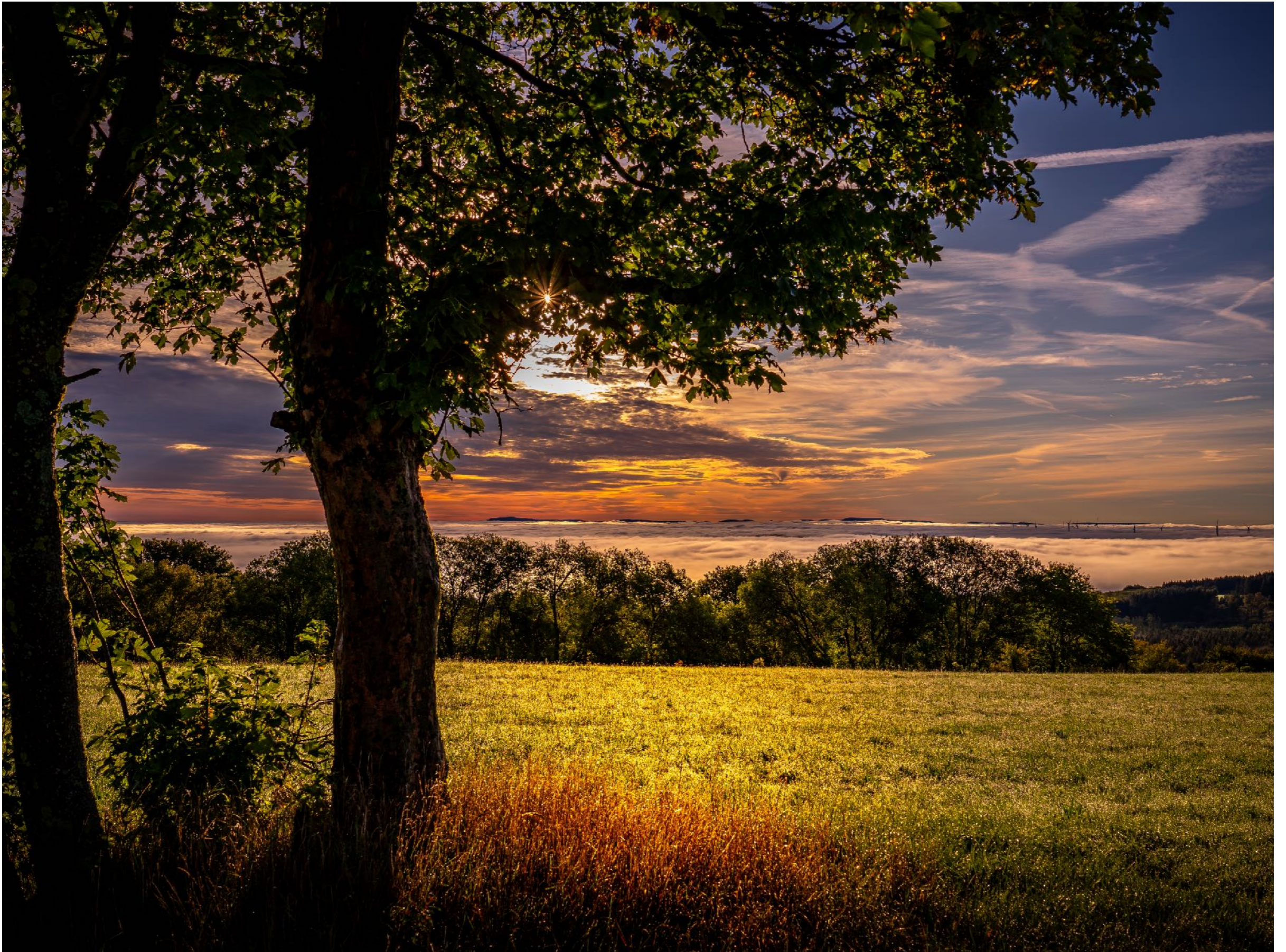
Wunderschöne Morgenstimmung mit Hochnebel über der Hochebene rund um Grebenhain und Crainfeld | f8 | 1/320 | -0,3 | ISO 100 |