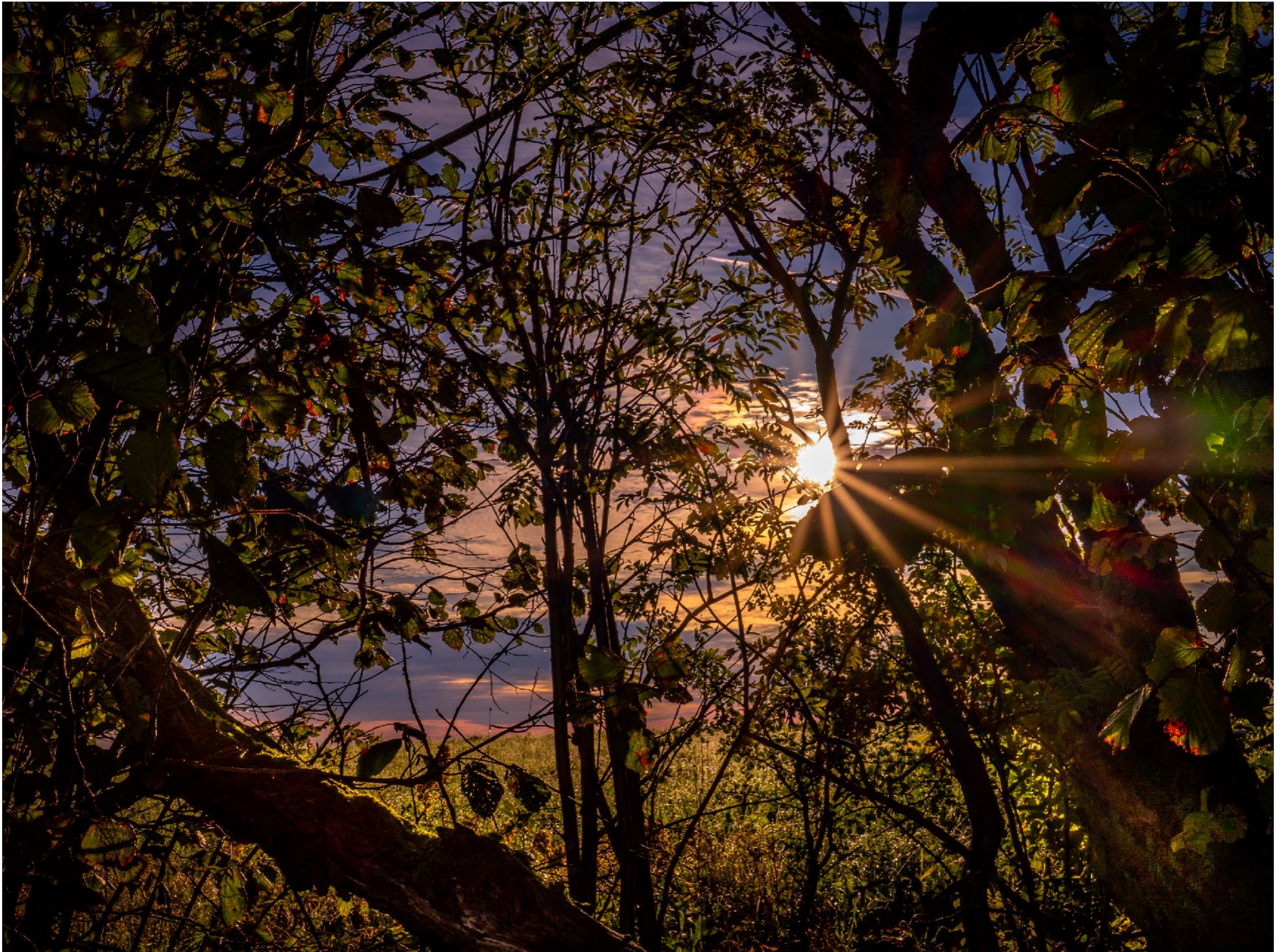
Ein Sonnenstern mit Schwerpunkt nach rechts | 20,0 | 1/320 | -2,7 | ISO 100 |