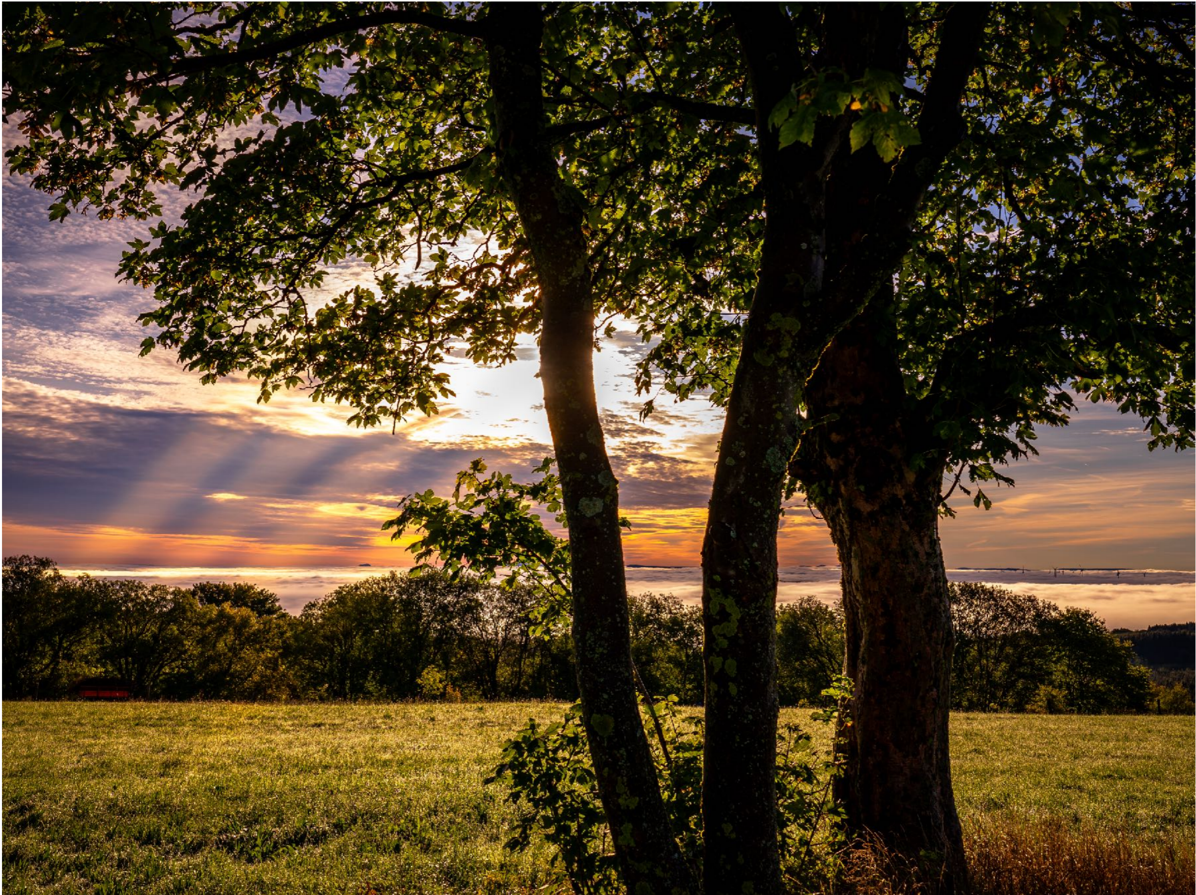
Vordergrund verleiht dem Weitwinkelfoto Tiefe | f8 | 1/250 | -0,3 | ISO 100 |