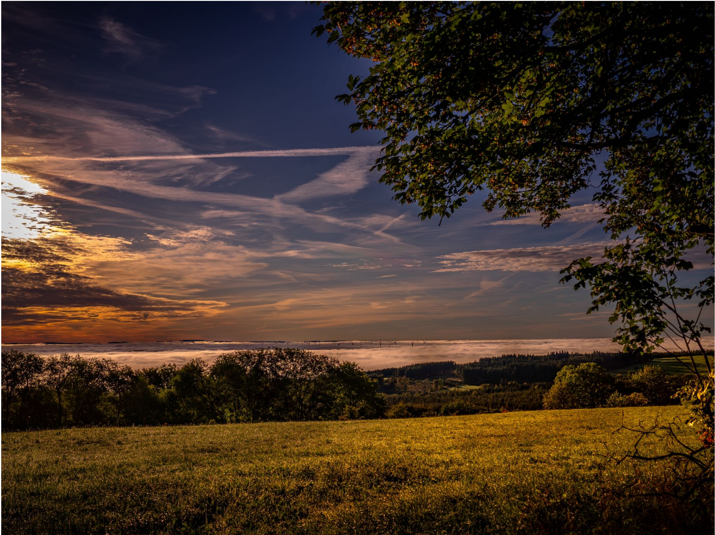
Wolkenmeer und spätsommerliche Morgenstimmung | f8 | 1/1000 | 0,0 | ISO 100 |