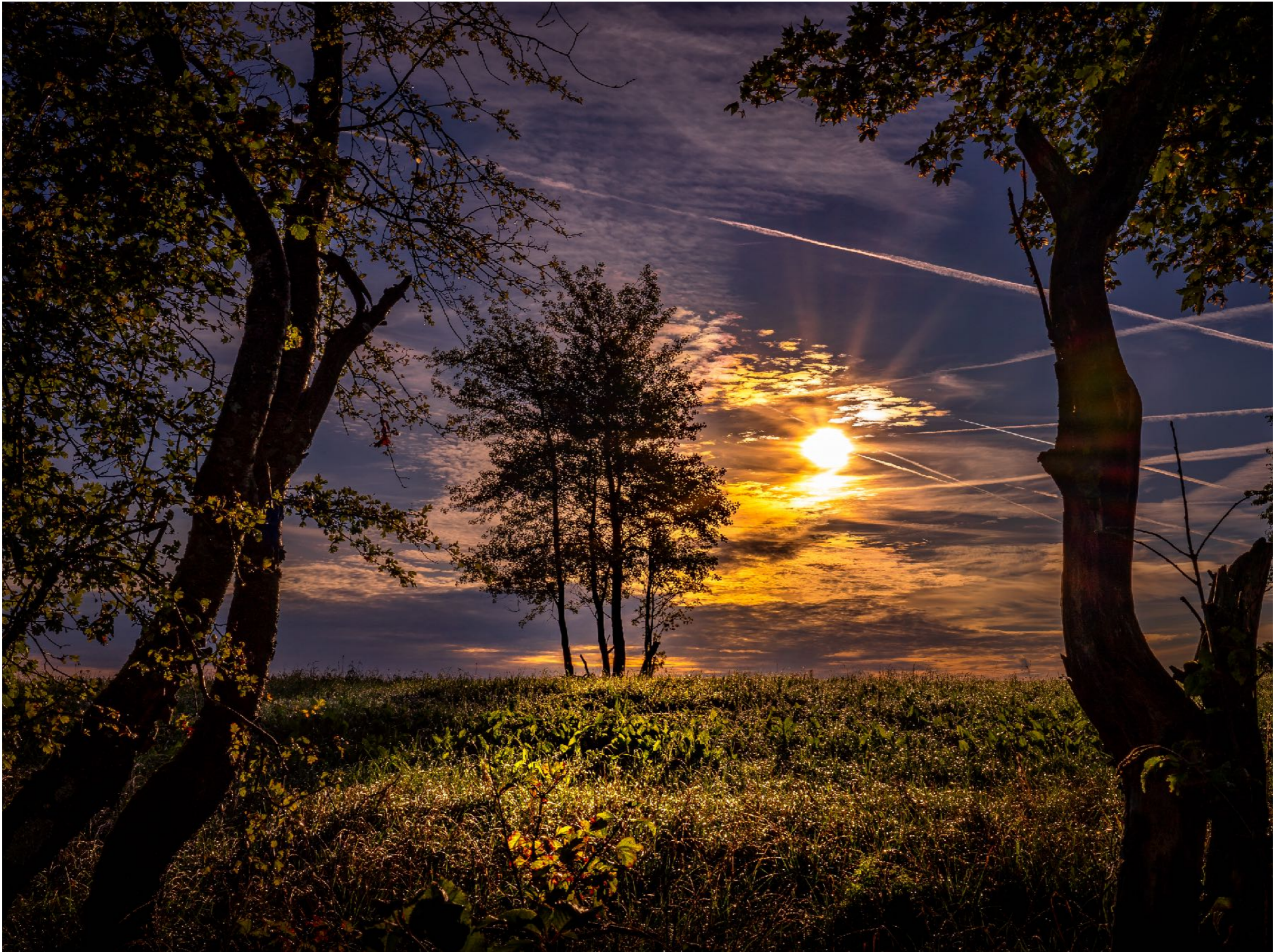
Stimmungsvolle Szene mit Licht und Schatten | f20,0 | 1/640 | -2,7 | ISO 100 |