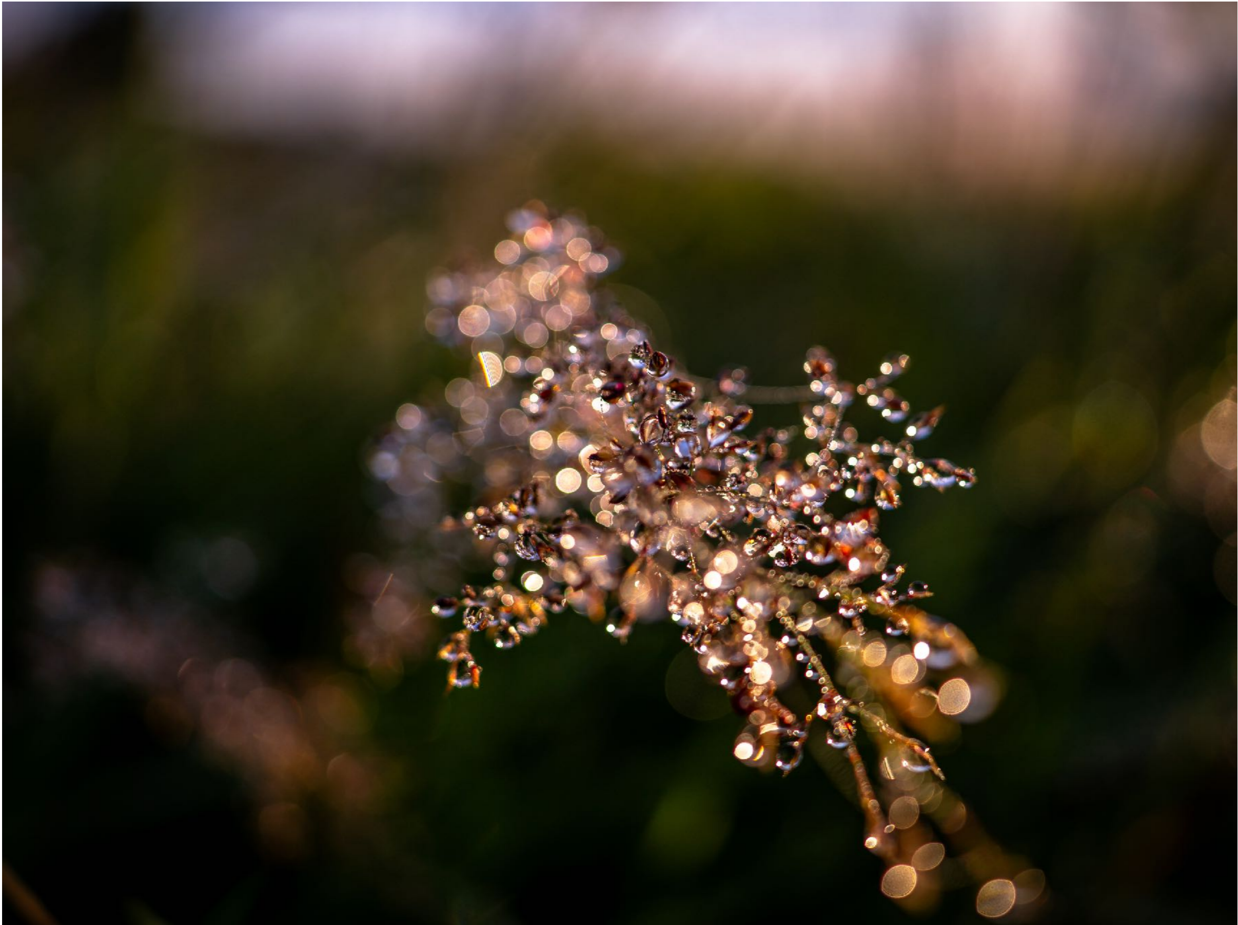
Frühtau auf Pflanzen mit einer Makroaufnahme | f2.8 | 1/250 | -1,7 | ISO 100 |