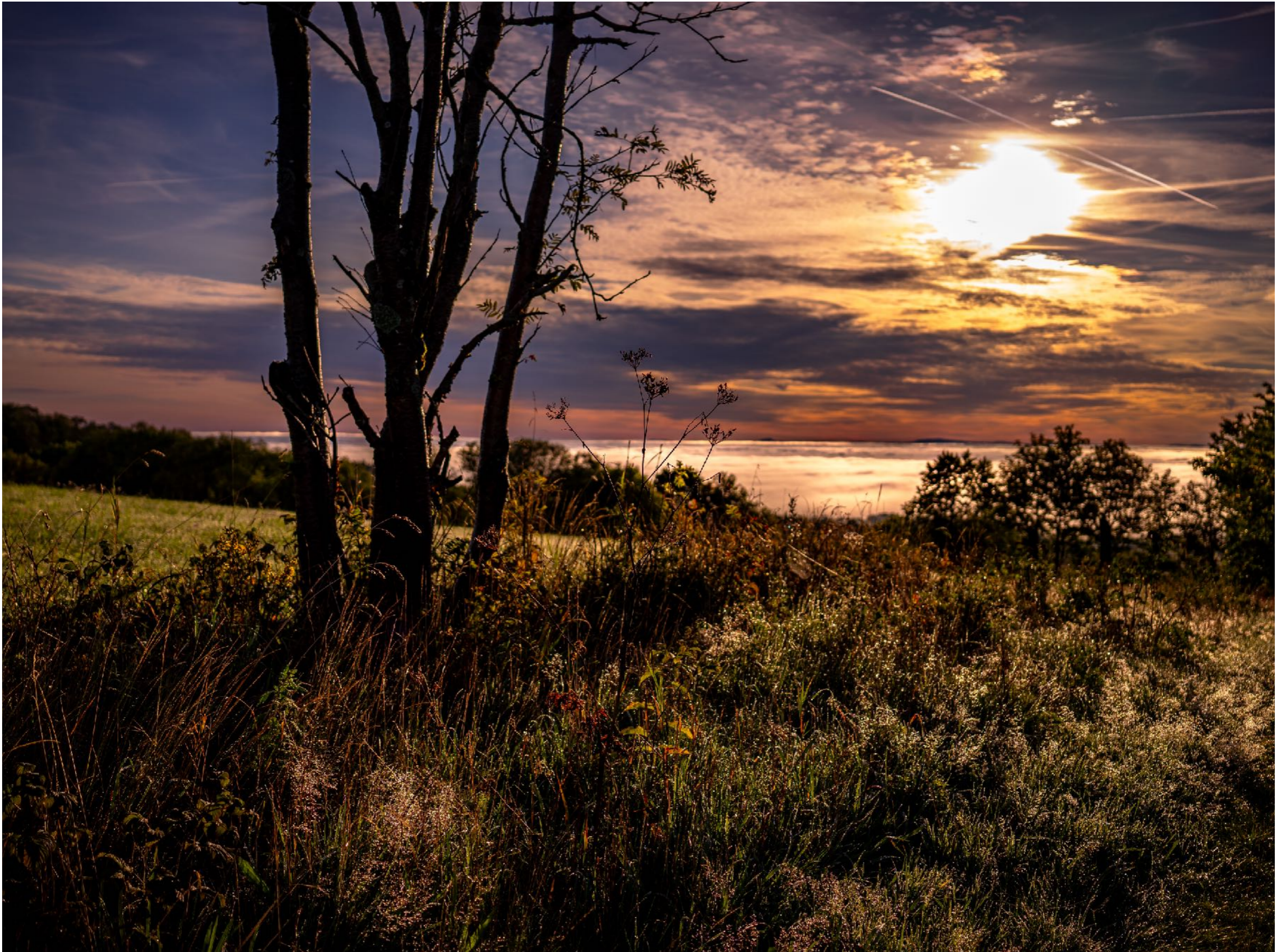
Das Öffnen der Blendenlamellen macht den Hintergrund unscharf, und hebt die Nähe hervor. | f3,5 | 1/4000 | -1,7 | ISO 100 |