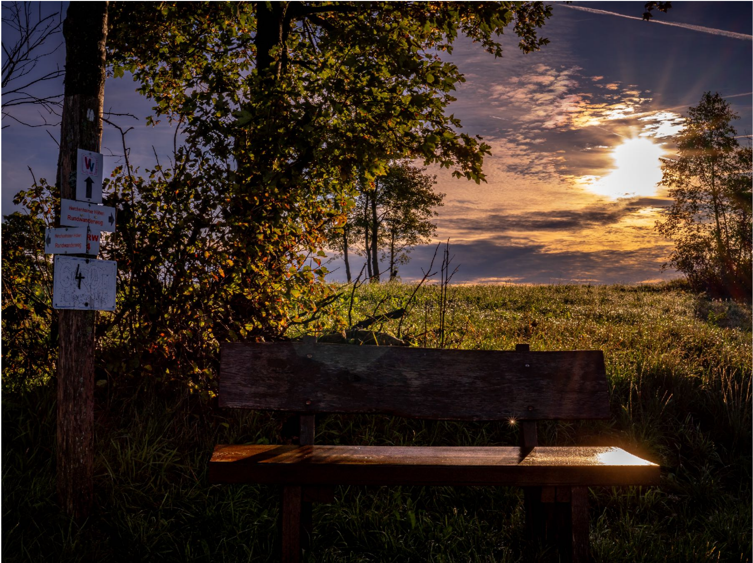
Auf 640 m NN hat man oft diese schöne Wetterlage | f20,0 | 1/125 | -1,7 | ISO 100 |