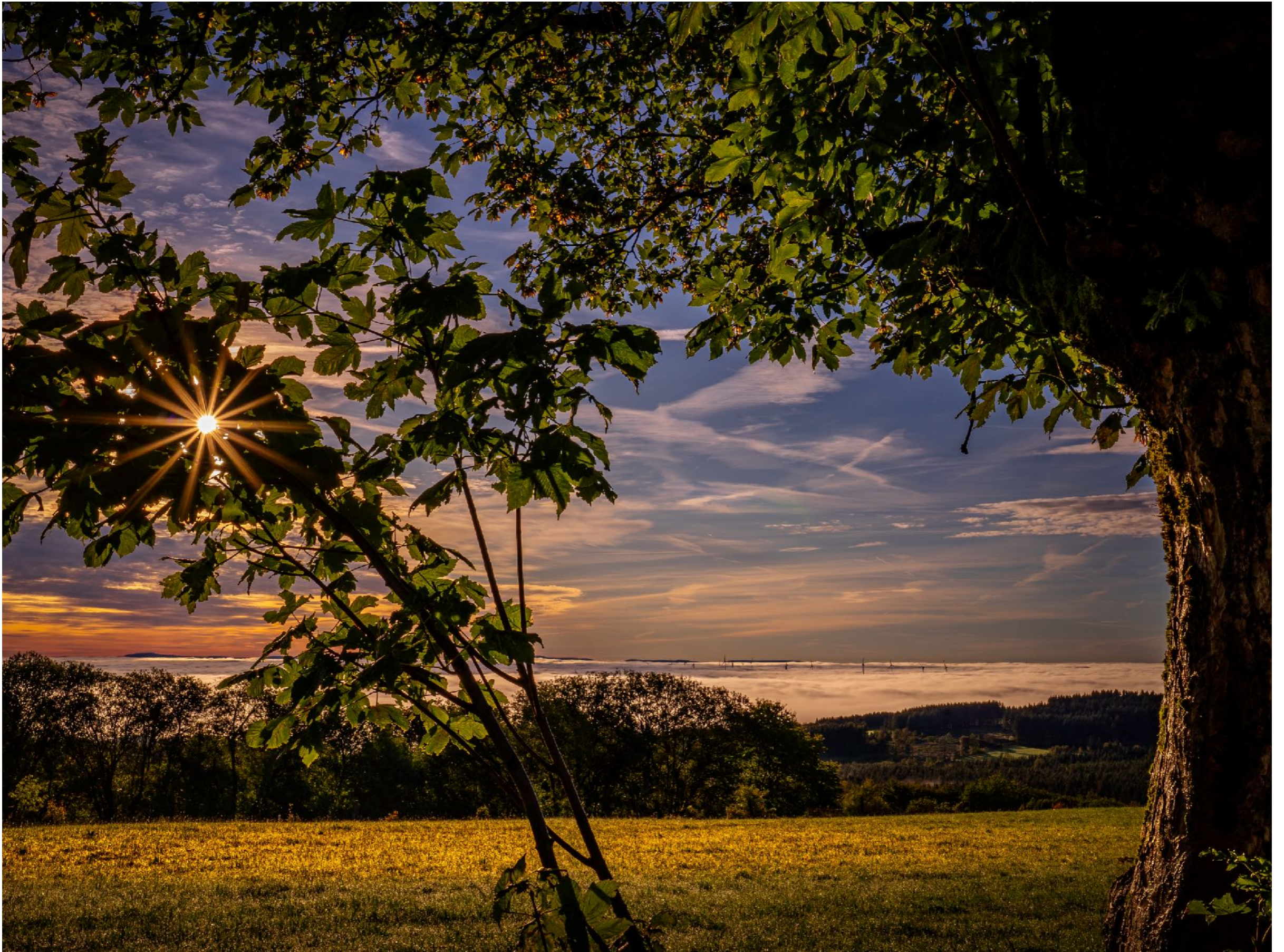
Der Baum verleiht dem Foto einen Rahmen | f8 | 1/1000 | -1 | ISO 100 |