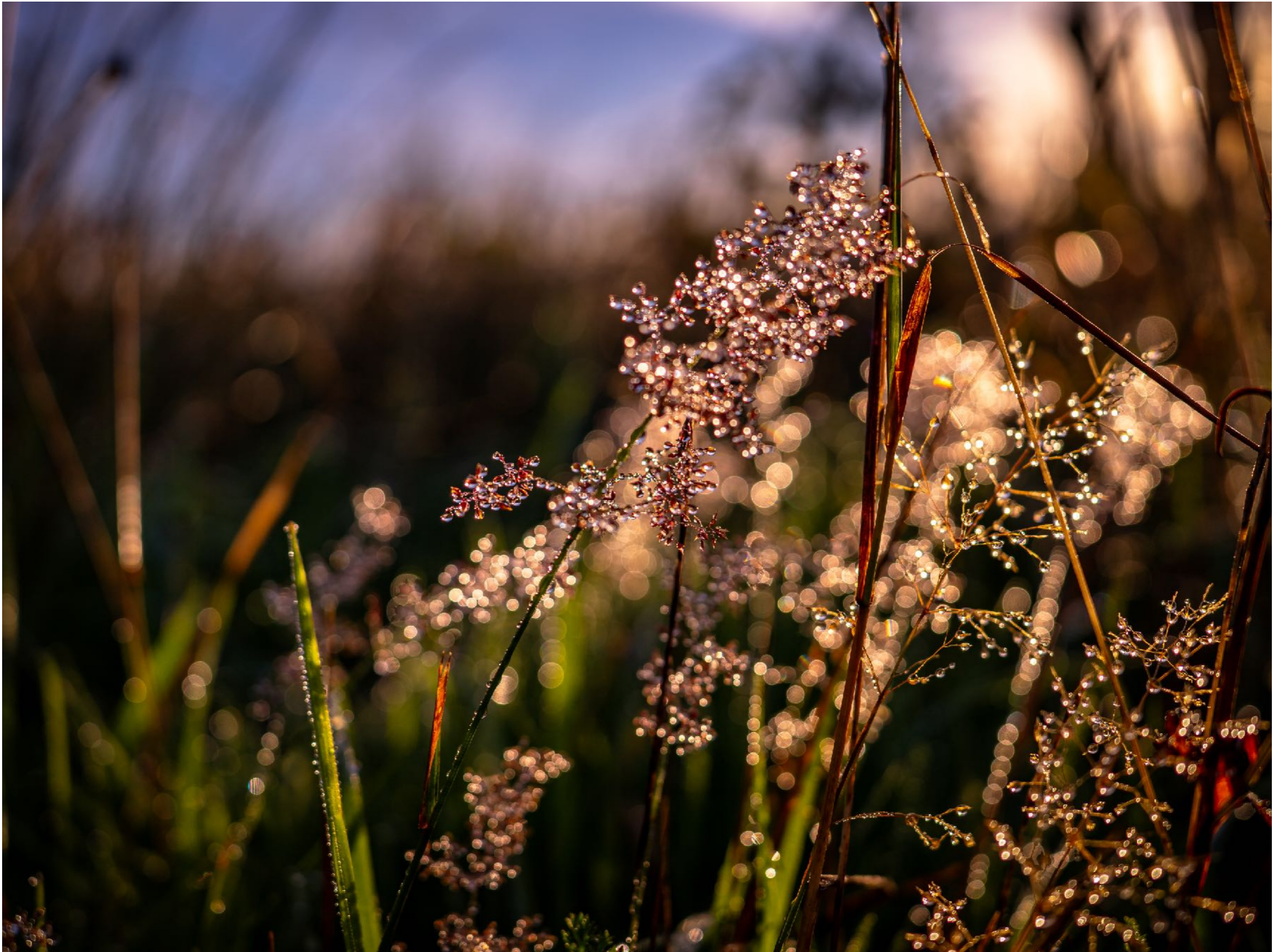
Hier in einer Nahaufnahme | f3,5 | 1/600 | -1,7 | ISO 100 |