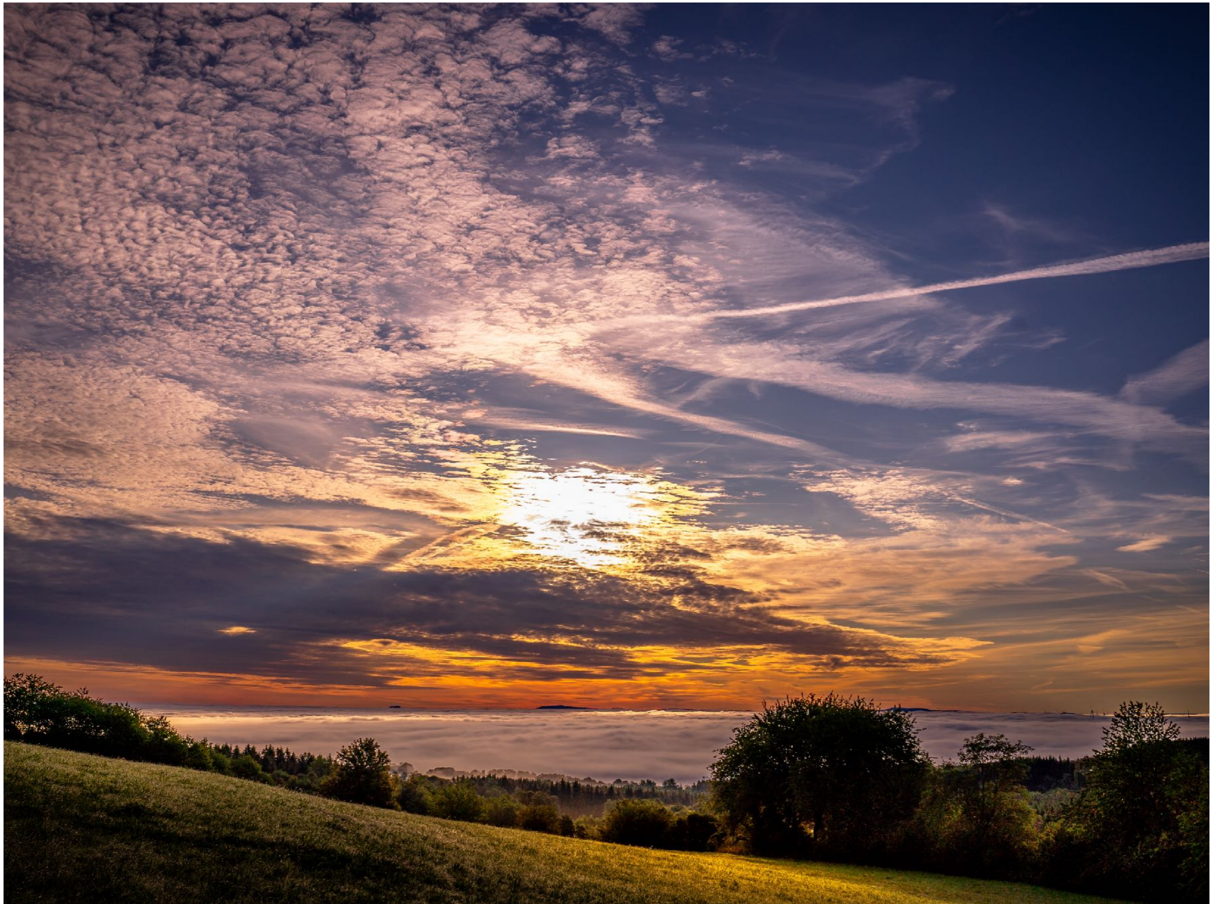
Wir schauen bei den Fotos in Richtung Rhön | f8 | 1/1600 | -0,3 | ISO 100 |