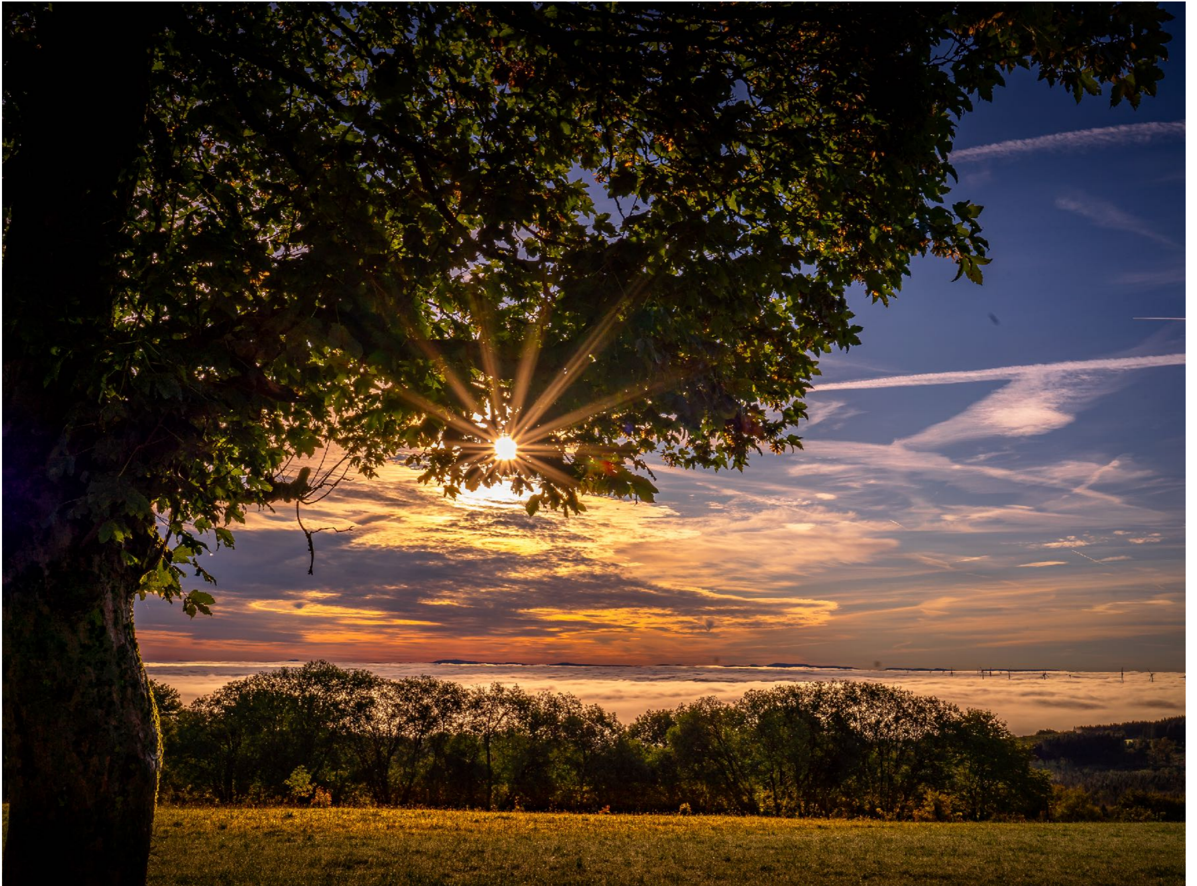
Sonnensterne schaffen Lichteffekte in das Foto. Sie entstehen durch die Lamellenanzahl des Objektivs | f20 | 1/200 | -1 | ISO 100 |