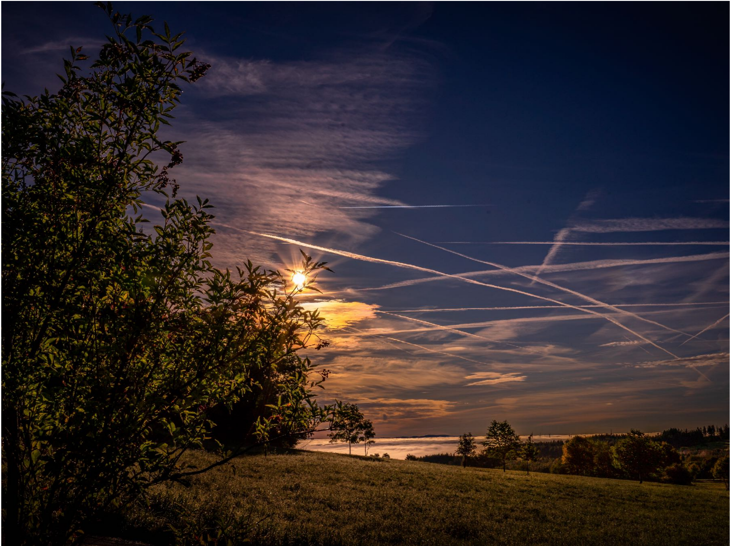
Viele Flugbewegungen am Himmel des Vulkans | f20,0 | 1/1000 | -2,7 | ISO 100 |